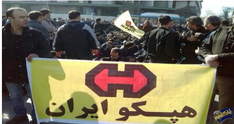
آگهی فراخوان عمومی شناسایی متقاضیان بالقوه خرید سهام شرکت تولید تجهیزات سنگین - هیکو (سهامی عام)